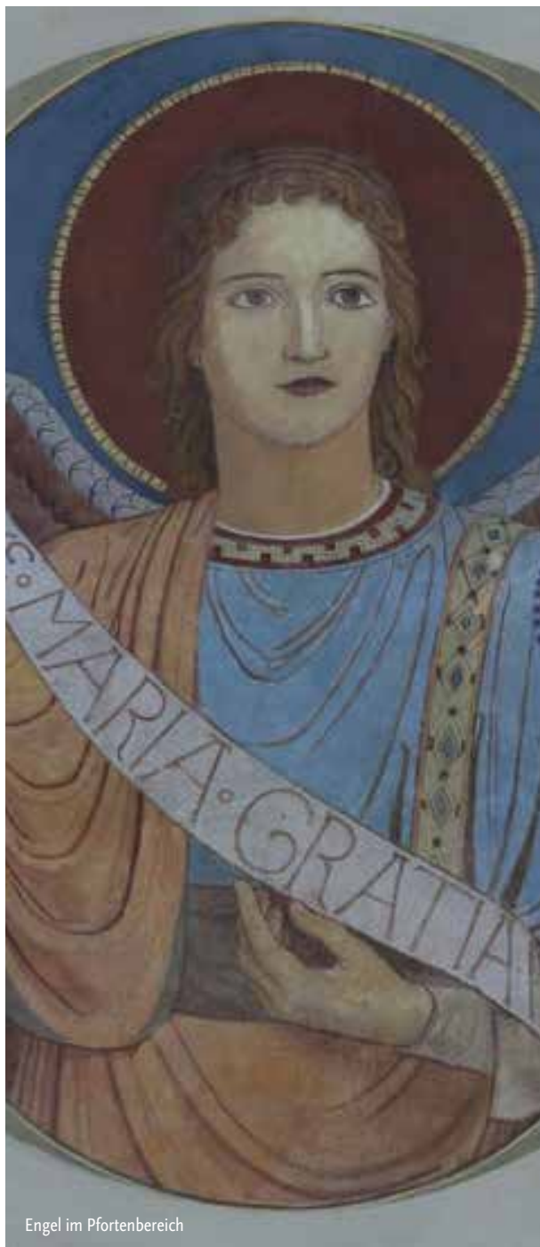
Engel im Pfortenbereich