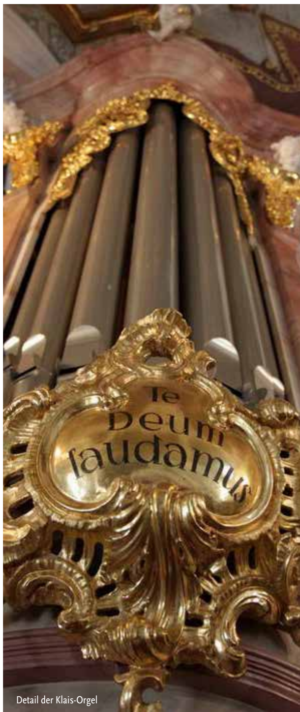
Detail der Klais-Orgel